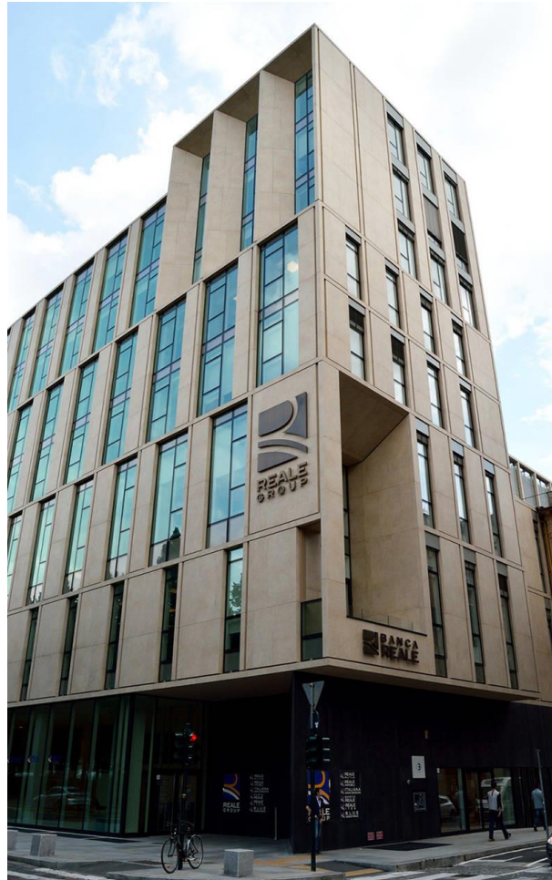
Reale Mutua, esterno

Specializzata nella produzione di sistemi per tende e tende tecniche , Mottura SpA è cresciuta negli anni grazie alla presenza interna di una filiera completa e alla capacità di seguire personalmente tutto il processo produttivo completo, dalla materia prima al prodotto finito. Mottura ha sviluppato nel tempo un'attenta cultura del progetto made to measure , esprimendola ai massimi termini nella divisione Contract, una realtà industriale all'avanguardia potenziata dalla grande esperienza e capacità aziendale di progettare soluzioni ad hoc nei diversi campi: hospitality, multi-apartment, spazi pubblici per il retail e per le aziende.