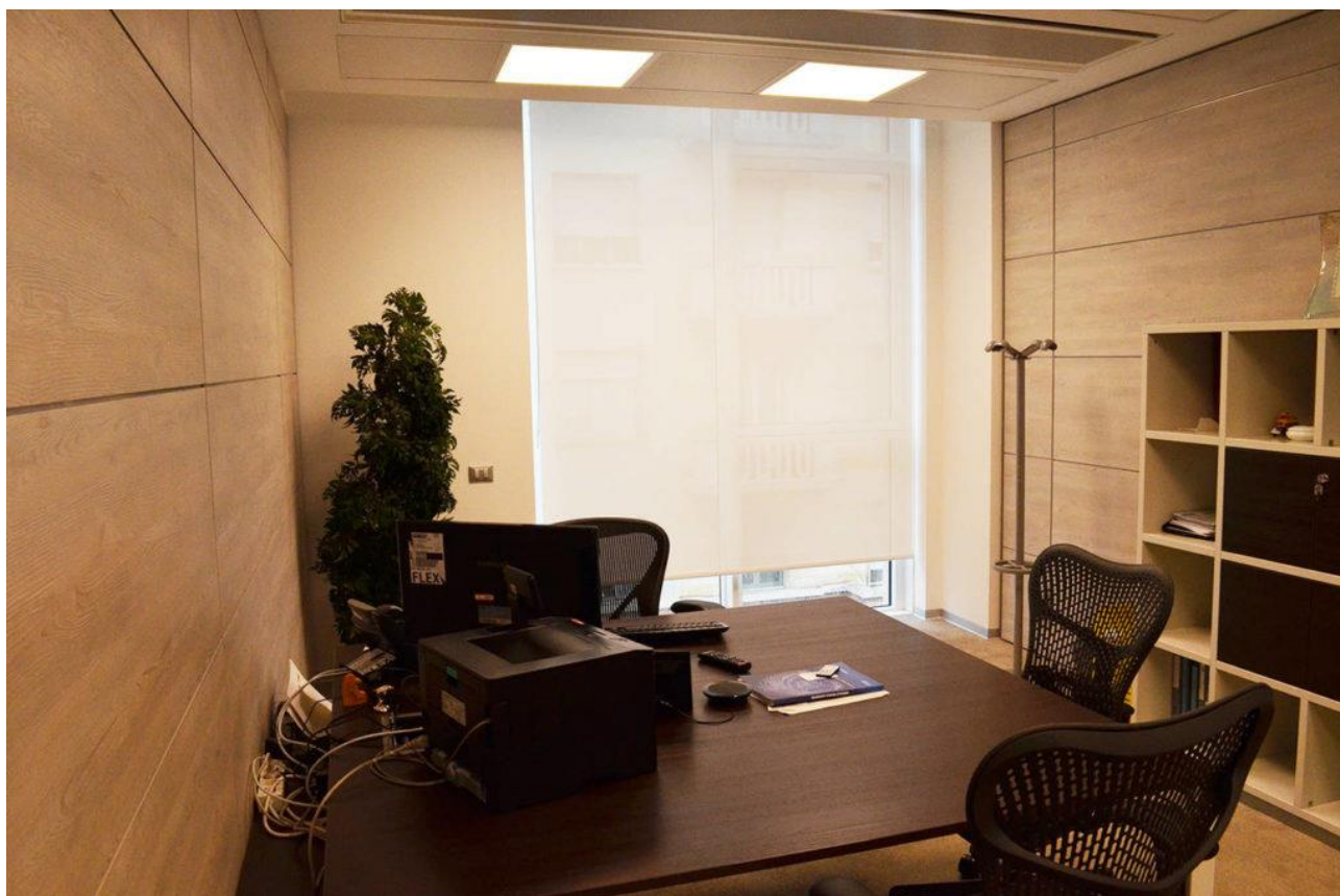
Reale Mutua, interno

Mottura SpA, nel tempo ha saputo coltivare e sviluppare una cultura del progetto su misura che trova la sua massima espressione nel settore Contract.